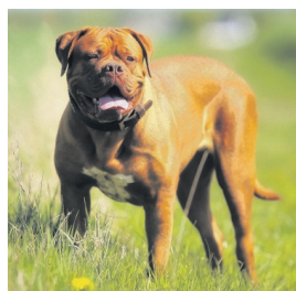
Dogo de Burdeos.