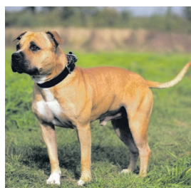
Staffordshire bull terrier.