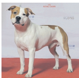
American staffordshire terrier.