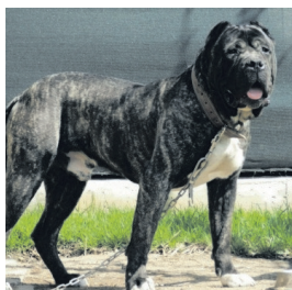
De presa canario.