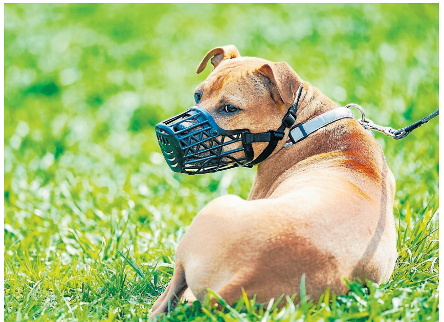
Los perros potencialmente peligrosos deben permanecer atados y con bozal en la vía pública. En Tarragona no llevar bozal es multa de 500 euros y no llevar al perro atado, de 800 euros.

Este año el Ayuntamiento ha creado un carnet para propietarios de perros potencialmente peligrosos que han enviado a todos los que tienen licencia. Dicho carnet deben llevarlo encima cuando portan el animal.