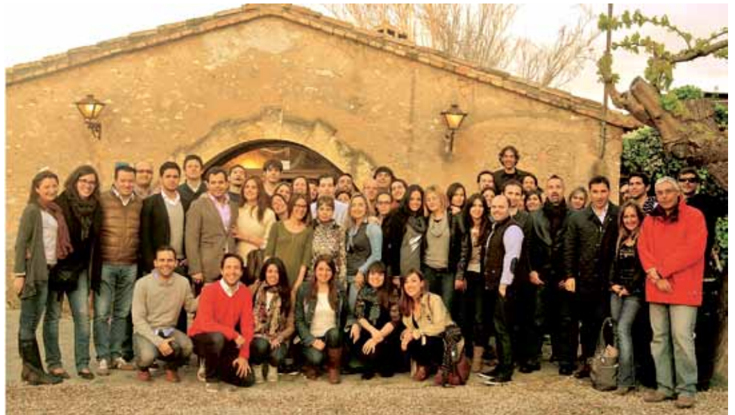
■ Reunió del JAC a Tarragona i dinar calçotada.

El servei de tutoria al nou col·legiat, que s'ofereix entre l'ICAT i el GAJ, està coordinat per la