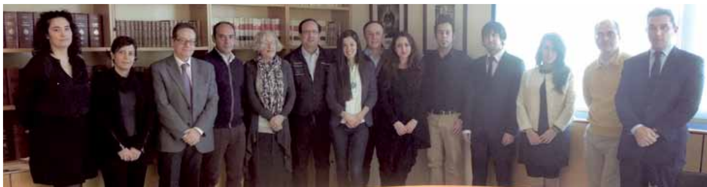
■ Acte de benvinguda celebrat el mes de febrer.