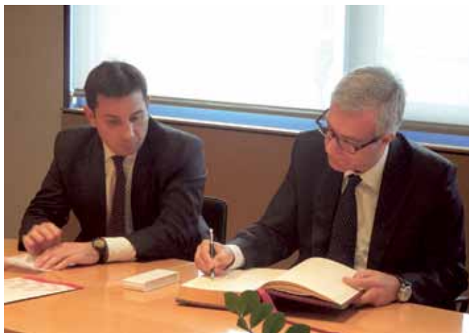
■ L'alcalde, amb el degà del col·legi, en el moment de signar en el Llibre d'Honor.

Com a entitat de dret públic, la reunió amb els membres de Junta va servir també per posar damunt la taula temes ja