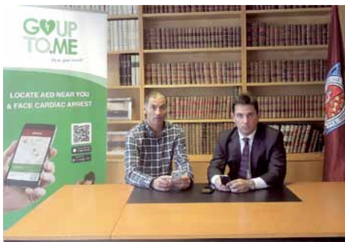
Signatura de l'acord a la seu col·legial.

Entre els dies 14 i 25 d'abril, l'app Gouptome es va poder descarregar de forma gratuïta per als col·legiats tant en la versió per a iPhone, com en versió