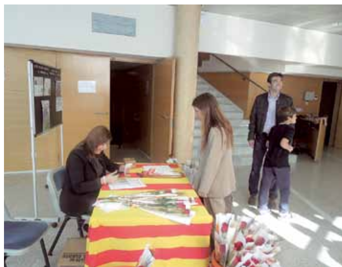
■ Una col·legiada recollint la seva rosa.

venta unes polseres solidàries especialment creades per aquesta festivitat. La suma de les vostres aportacions va permetre obtenir 1.010,50€ que aniran destinats al finançament de projectes de recerca per la lluita contra el càncer infantil de l'Hospital Sant Joan de Déu. Moltes gràcies per la vostra col·laboració!