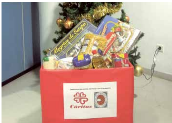
■ Detall d'algun dels aliments recollits a la seu de l'ICAT.

A través d'aquesta campanya, la Junta de Govern ha volgut continuar donant suport a les accions de Càritas, amb la qual ja manté un conveni de col·laboració amb la creació el mes de maig de 2013 d'un torn de voluntariat no remunerat, i posar el seu granet de sorra realitzant accions directes per fomentar i facilitar la participació del col·lectiu en iniciatives de suport a aquelles persones que estan vivint situacions