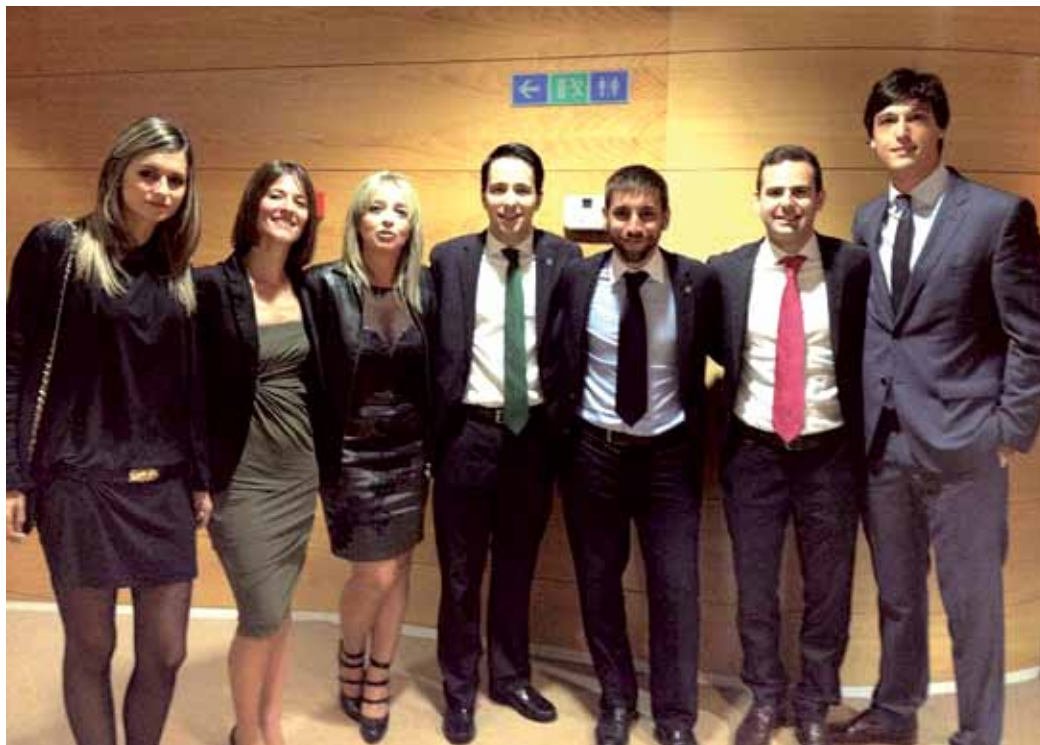
■ La Junta Directiva del GAJ durant els actes de la festa col·legial.

2013 membres del Grup es van desplaçar a la seu de l'Il·lustre Col·legi d'Advocats de Terrassa per assistir a la celebració de la Junta de Govern de Joves Advocats de Catalunya (JAC). El dia 13, 14 i 15 de desembre de 2013 membres del Grup es van desplaçar a Logroño per tal d'assistir a la reunió trimestral de la CEAJ. El dia 18 de gener de 2014, membres del GAJ van anar a la reunió de Joves Advocats de Catalunya (JAC) a la seu de l'Il·lustre Col·legi d'Advocats de Sabadell. El dia 7 de febrer de 2014 van assistir en representació del GAJ a la festivitat de Sant Raimon de Penyafort a la seu de l'ICAB. Els dies 7, 8 i 9 de març de 2014 els membres del grup es van desplaçar a la ciutat de Toledo a la reunió trimestral de la CEAJ. El dissabte 22 de març de 2014, la reunió del JAC es va celebrar a la seu del nostre Col·legi, que va obrir les seves portes a advocats de tot Catalunya. Finalitzada la trobada, es va celebrar un dinar caçotada que va comptar amb l'as-