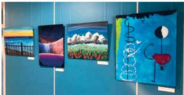
Mostra dels quadres exposats a la seu col·legial