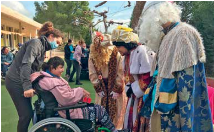
Acte d'entrega dels regals als alumnes del Centre

El passat 19 de desembre i en el marc de col·laboració entre ambdues institucions, companys i companyes del Grup de l'Advocacia Jove i membres de la Junta de Govern del Col·legi van visitar als nens i nenes d'aquesta associació acompanyant als patges reials que, com és tradició, visiten cada any aquest centre d'educació especial. Els patges van repartir regals als infants i alumnes del centre que els van rebre amb molta il·lusió.