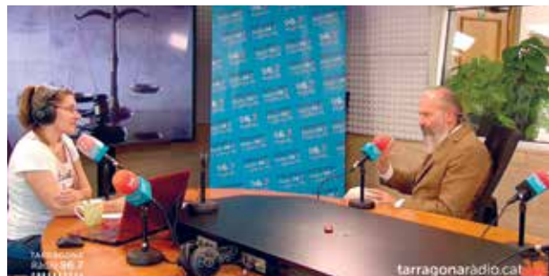
Reverter i Núria Cartañà durant l'emissió del programa

i per tant són aquestes entitats les que haurien de crear el sistema de defensa per evitar els riscos i delictes derivats d'aquesta operativa". També subratlla que "els bancs sovint emplacen als afectats per fishing a la via penal, situació que fa encara més lent el procediment i en cap cas garanteix la restitució dels diners sostrets".