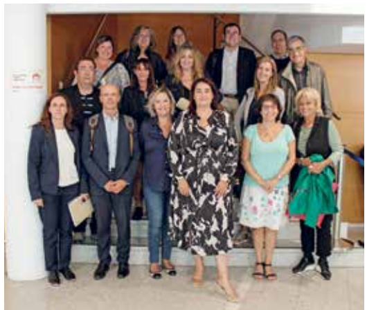
Companys i companyes de les diferents comissions del TOAD del CICAC

La Comissió del Torn d'Ofici del Consell de l'Advocacia Catalana es va reunir el passat divendres 30 d'octubre a la seu del nostre Col·legi. Durant una intensa jornada de treball, els membres de la Comissió van tractar diferents temes com els referents als criteris interpretatius dels mòduls de compensació o les instruccions per a justificar actuacions, entre d'altres. Des de l'ICAT agraïm als assistents la seva participació. Esperem en el futur poder continuar programant aquestes reunions que ens permeten compartir experiències, ampliar els coneixements i seguir treballant en la direcció correcta per oferir la millor atenció i serveis a les persones col·legiades.