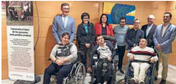
Acte d'inauguració de l'exposició

El passat dia 4 de novembre la seu col·legial va ser l'escenari de la inauguració de l'exposició "Plenituds artístiques" de la Fundació la Muntanyeta. Aquesta mostra, que es va poder visitar fins al dia 25 de novembre, va reunir una trentena d'obres creades de manera conjunta per les persones amb paràlisi cerebral i els professionals d'aquesta entitat. Els quadres exposats es van poder adquirir, com així van fer alguns col·legiats, mitjançant un donatiu per donar suport als projectes en benefici de les persones amb paràlisi cerebral.