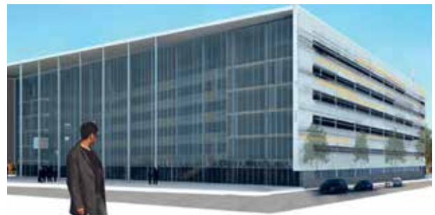
Imatge virtual del Fòrum de la Justícia de Tarragona