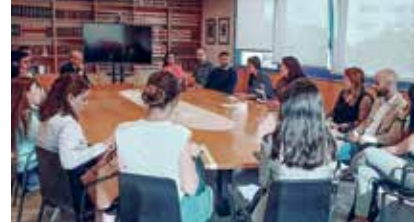
Sessió de benvinguda als nous col·legiats