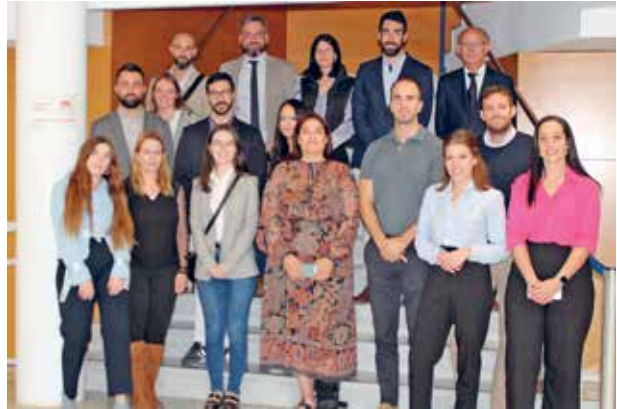
Acte de benvinguda del passat mes d'octubre

Aquestes reunions de caire més informal, se celebren periòdicament amb la finalitat d'oferir una atenció més personalitzada per part dels màxims responsables de la institució per poder atendre els dubtes o suggeriments dels nous companys i companyes de professió. Finalitzada la reunió, es va realitzar una visita a les instal·lacions col·legials.