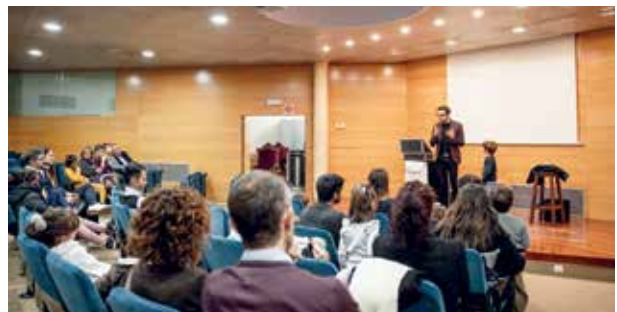
Espectacle de màgia per amenitzar l'espera a l'arribada dels patges reials

tents. Esperem de tot cor poder comptar amb vosaltres en properes edicions i us desitgem un molt bon any 2023!