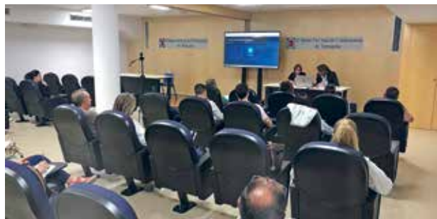
Assistents a la formació