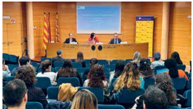
Nombrosos assistents a les jornades de l'ICAT

consolidar aquestes jornades de primer nivell a la ciutat. El president de l'APT va posar èmfasi en la complexitat jurídica i administrativa d'una Autoritat Portuària "que és enorme i que té múltiples vectors en joc". Vectors –va explicar– que van més enllà de l'àmbit pròpiament portuari amb implicacions molt rellevants tant en l'àmbit urbanístic, com en el comercial i el de les relacions laborals, entre d'altres. Garreta va finalitzar la seva intervenció agraint a totes les persones assistents a l'acte el seu compromís per reforçar i potenciar els coneixements dels experts en Dret Portuari.