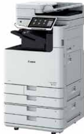
Sèrie imageRUNNER ADVANCE