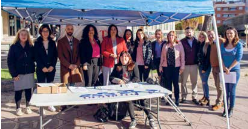
Acte reivindicatiu a la Rambla Lluís Companys

La diada va comptar amb l'activa participació del GAJ des de l'estand informatiu situat a la Rambla Lluís Companys.