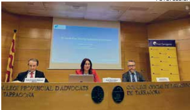
Taula d'inauguració de les Jornades