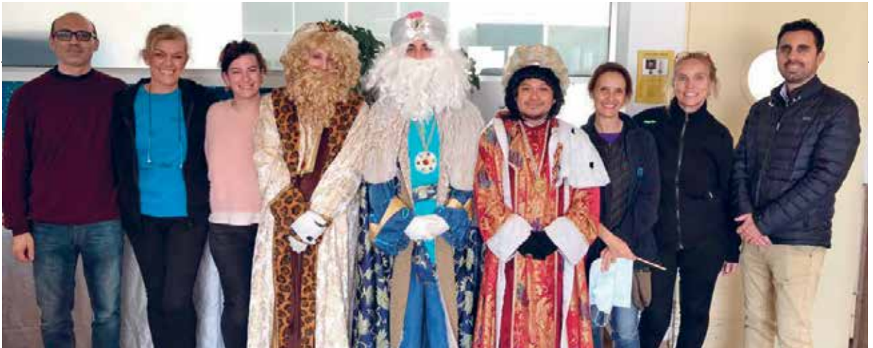
Els patges reials de l'ICAT amb l'equip professional de la Muntanyeta