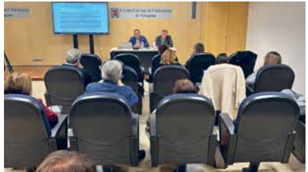
Assistents a la formació que es va realitzar presencialment a l'ICAT