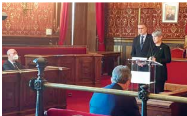
La consellera de Justícia i l'Alcalde de Tarragona anunciant la construcció del Fòrum Judicial

no només per als professionals, sinó també per a tota la societat". La degana ha instat a les administracions a "complir els terminis que han anunciat avui, perquè aquest projecte porta més de vint anys esperant concrecions i perpetuant el greuge comparatiu de Tarragona com a única ciutat catalana que no té les dependències judicials concentrades en un únic equipament".