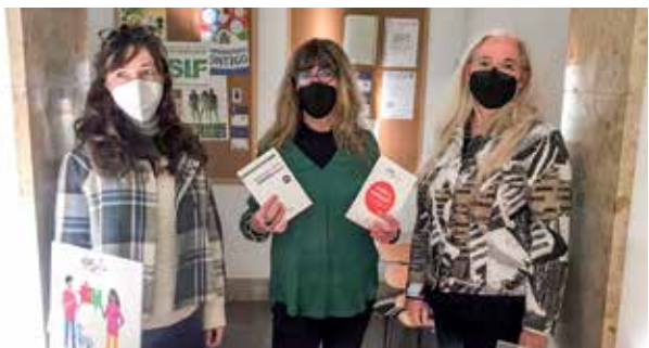
Jornada de difusió del SOM a la seu dels jutjats de Tarragona