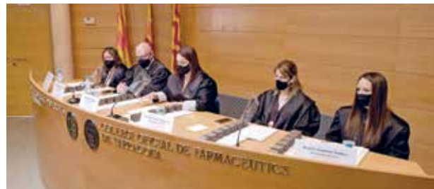
Taula presidencial durant l'acte d'imposició de togues