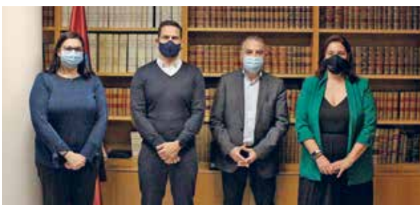
Trobada amb el Col·legi de Graduats Socials