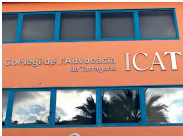
'Advocacia' substitueix 'advocats' per evitar el llenguatge masclista

L'any 2018 l'ICAT va aprovar el canvi de nom de la institució, passant a ser "Col·legi de l'Advocacia de Tarragona". Aquesta actualització va ser promoguda per la Comissió de Conciliació i Polítiques per a la Igualtat amb l'objectiu principal que la denominació fos més inclusiva en consonància amb altres iniciatives encaminades a potenciar la igualtat i la no discriminació entre els col·legiats i col·legiades. Des d'aleshores, s'ha anat introduint progressivament aquesta denominació tant als espais físics com digitals. El passat mes d'octubre es va materialitzar el canvi a la façana de la nostra seu institucional.