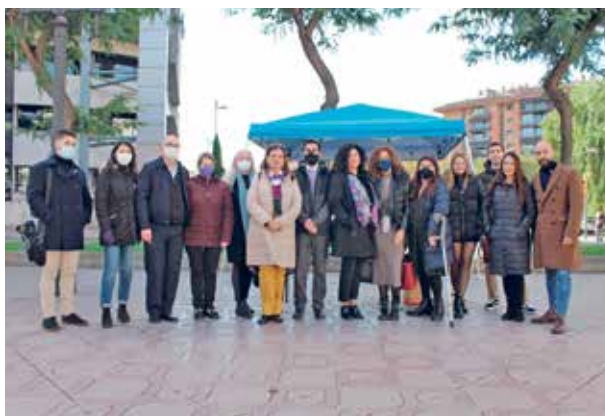
Acte commemoratiu del 25N a la Rambla President Companys