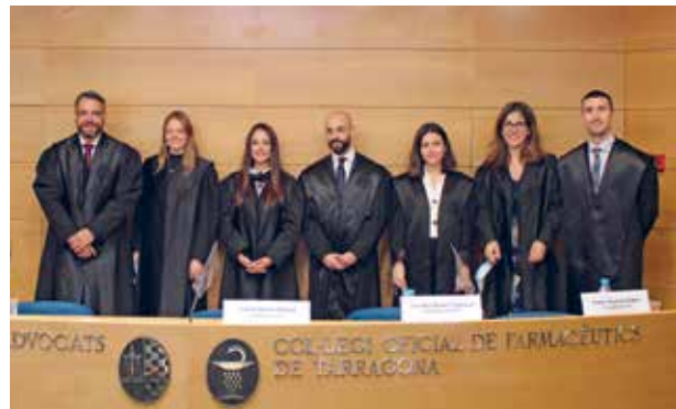
Acte de presa de possessió de la nova junta del GAJT

Des de l'ICAT volem agrair la tasca duta a terme per l'antiga Junta Directiva i desitgem al nou equip molts encerts en aquesta nova etapa.