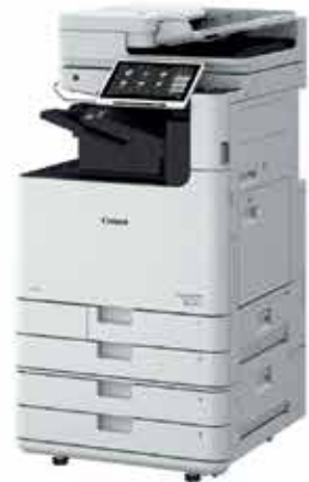
Serie imageRUNNER ADVANCE