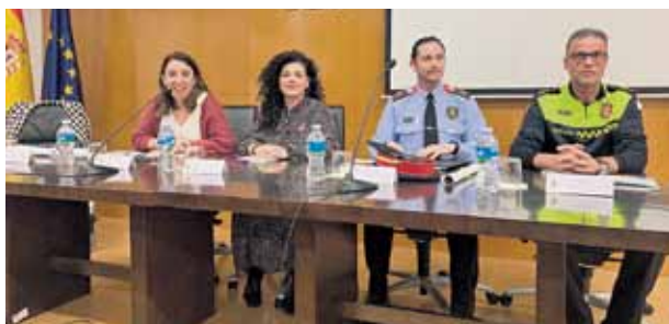
Taula Rodona organitzada per la Subdelegació de Govern en motiu del Dia Internacional de l'Eliminació de la Violència Masclista.

Pel que fa a les activitats formatives, l'ICAT té previst celebrar diferents jornades sobre l'exercici de l'advocacia i la conciliació de la vida familiar, les persones amb discapacitat, sobre dones i esport i dones i empresa. Finalitzat el període d'implantació del catàleg de mesures aprovat, la Comissió de Conciliació n'avaluarà el grau d'assoliment a fi i efecte de determinar si la implantació del pla ha estat efectiva en la millora de les polítiques d'igualtat, no discriminació i conciliació en la nostra institució.