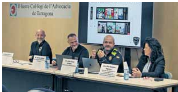
Jornada sobre delictes d'odi en el col·lectiu LGTBI.