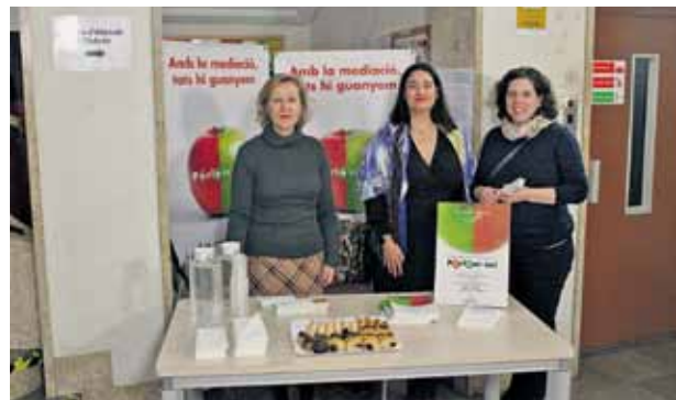
Taula de mediació situada als jutjats de Tarragona per celebrar el Dia Europeu de la Mediació.