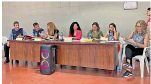
Xerrada sobre "Identificació i prevenció dels riscos en adolescents" celebrada el mes de setembre de 2019.

La primera fase d'implantació del pla d'igualtat i conciliació de l'ICAT es produeix durant el 2018. El canvi de nom de la institució i l'informe sobre el diagnòstic actual del nostre sector