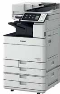
Serie imageRUNNER ADVANCE